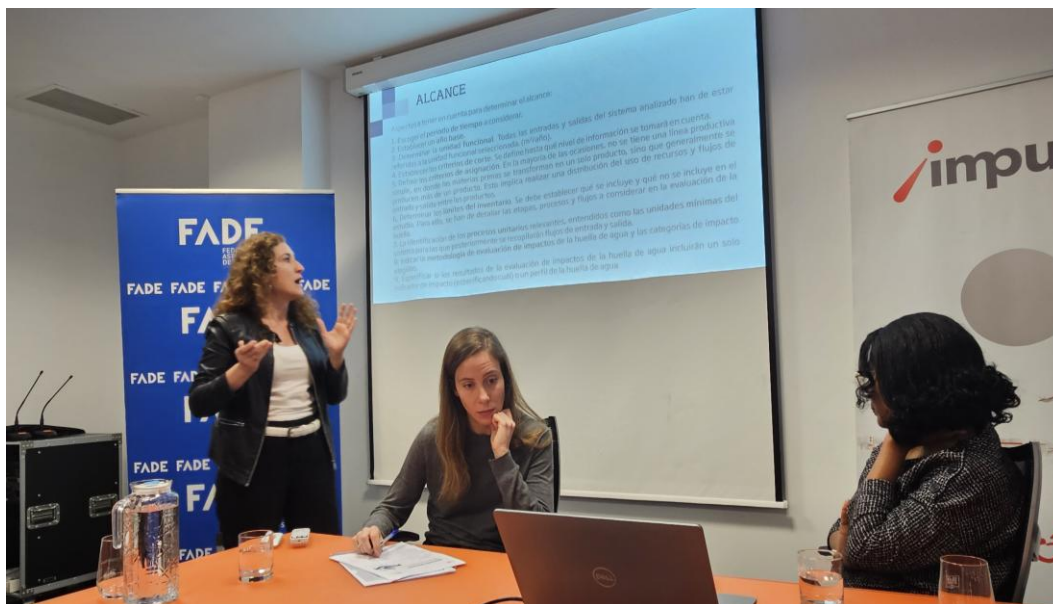
Ilustración 13. Participación y preguntas de los asistentes – Taller 4